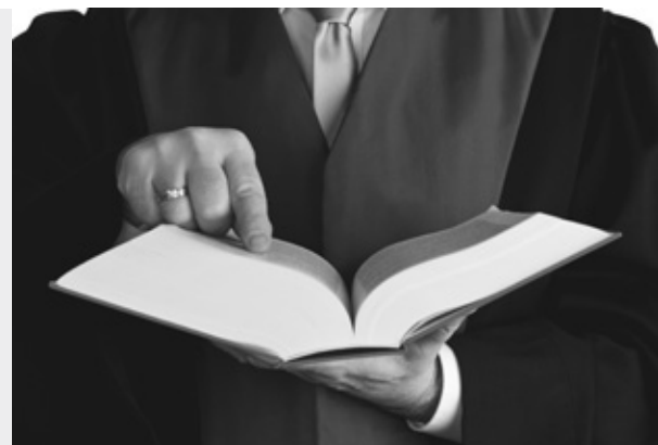
Eine Diskussion über Änderungsbedarfe im SGB VIII zur Weiterentwicklung der Hilfen zur Erziehung kann nicht über die Frage des individuellen Rechtsanspruchs nach § 27 SGB VIII geführt werden, sondern allenfalls über die Frage der Ausgestaltung der Hilfen in den §§ 28 – 35 SGB VIII.

Damit sind wahrscheinlich die relevanten Themen der kommenden Auseinandersetzungen benannt, auf die die freien Träger sich vorbereiten müssen. Es wird nicht um die Abschaffung des individuellen Rechtsanspruchs auf Hilfen zur Erziehung gehen, sondern um die Aufweichung des Wunsch- und Wahlrechts der Betroffenen und eine Veränderung des sozialrechtlichen Dreiecksverhältnisses von Leitungsberechtigten, Leistungsverpflichteten und Leistungserbringern mit einer erweiterten Definitionsmacht der öffentlichen Träger, die durch die „Wirkungs-“ und „Steuerungs“-Ideologie installiert wird.